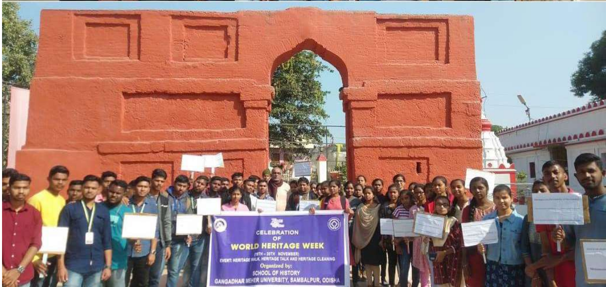
Celebration of World Heritage Week 2022