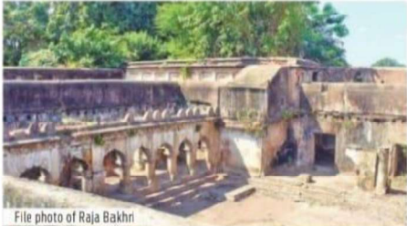
File photo of Raja Bakhri

unique initiative to identify and research on local historical monuments. "A few years back, INTACH had proposed the State government for renovation of Raja Bakhri. A detailed project report of ₹2.5 crore was also submitted. However, there has been no progress in this regard so far," he informed. Raja Bakhri is one of the biggest palaces in Odisha. It was built by King Chhatra Sai in the early 17th Century. The two-storey building has around 40 rooms. According to researchers, Surendra Sai had stayed in the palace for a few days during the 1857 uprising after he entered Sambalpur with 1,500 of his supporters. Besides, local freedom fighters had waved the national flag atop Raja Bakhri