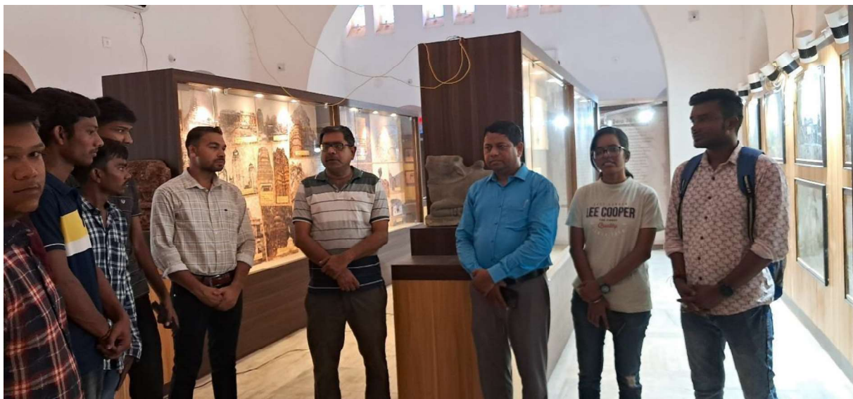
International Museum day observed at Veer Surendra Sai hall 2024