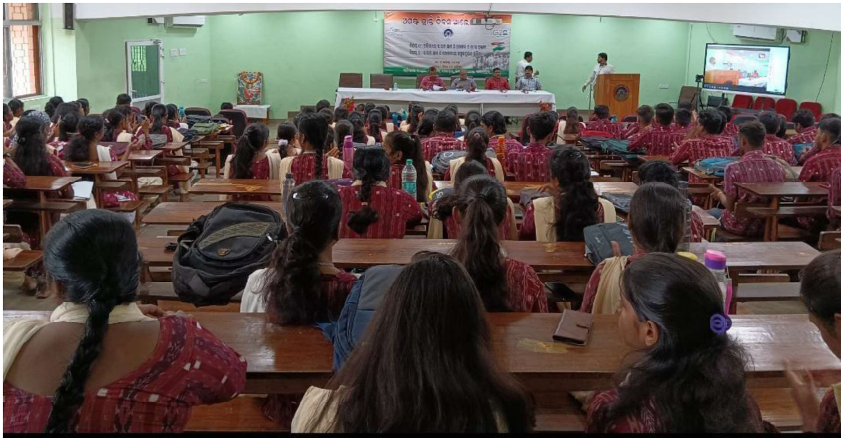
Participants in the observation of August Kranti on 9 th August 2023