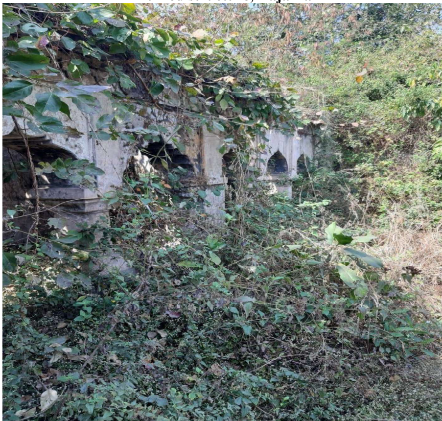
Ruined Structure of Raja Bakhri