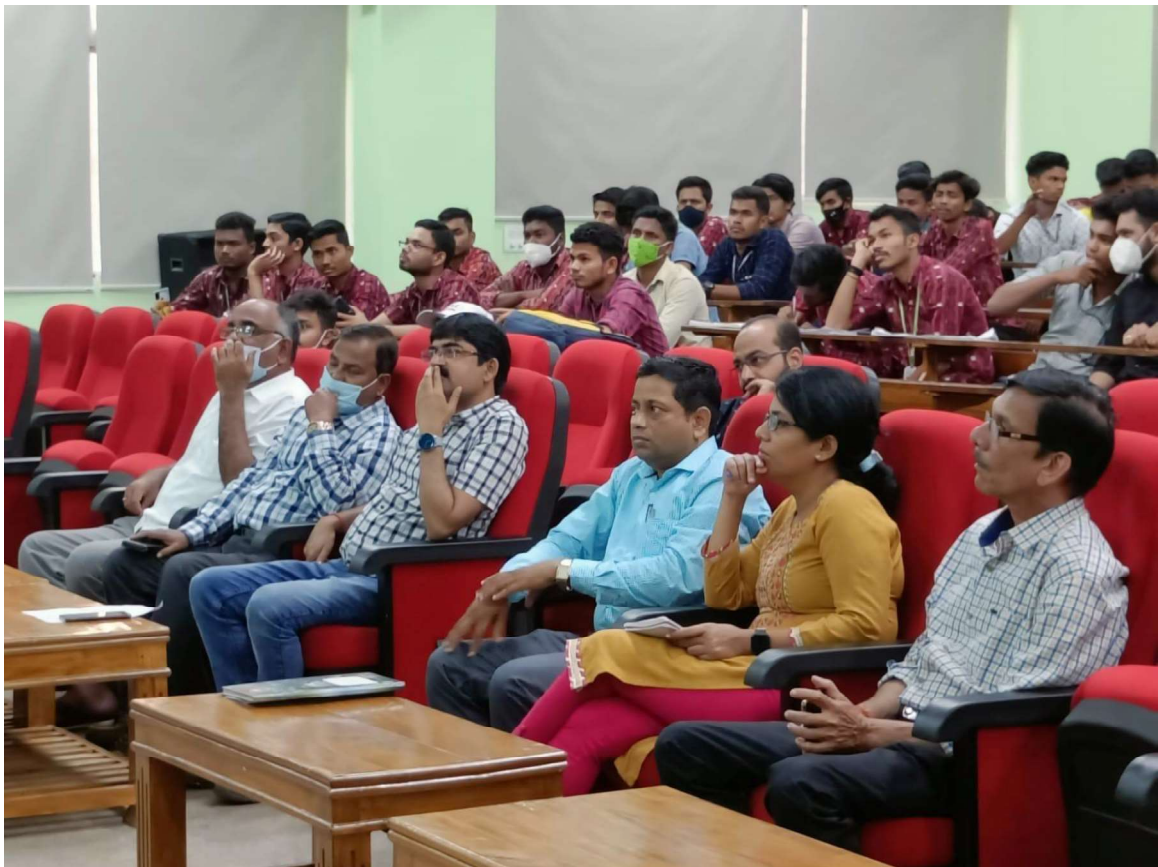
Celebration of World Heritage Day 2022