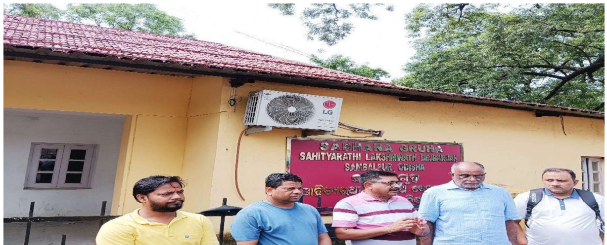
Resource persons, and participants in the Heritage Walk from town hall to Lakshinath Bezbaroa house