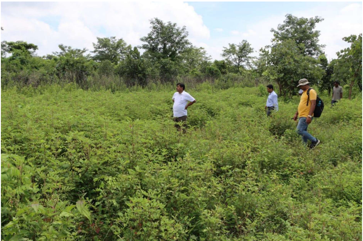
ASI team and scholars investigated the archaeological site