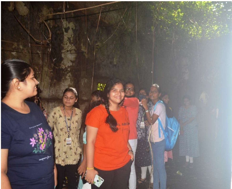
Students at the heritage site