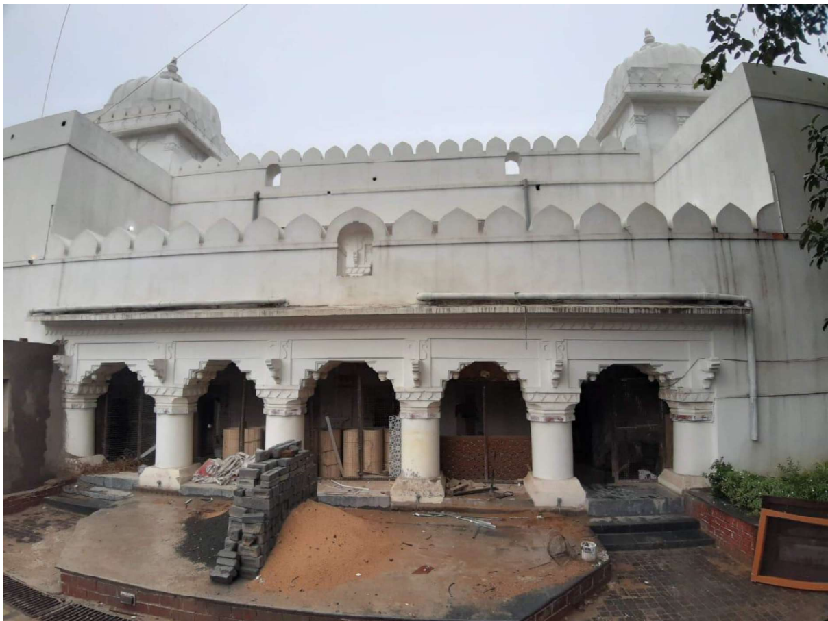
View of the Rani Bakhri(during the inspection )