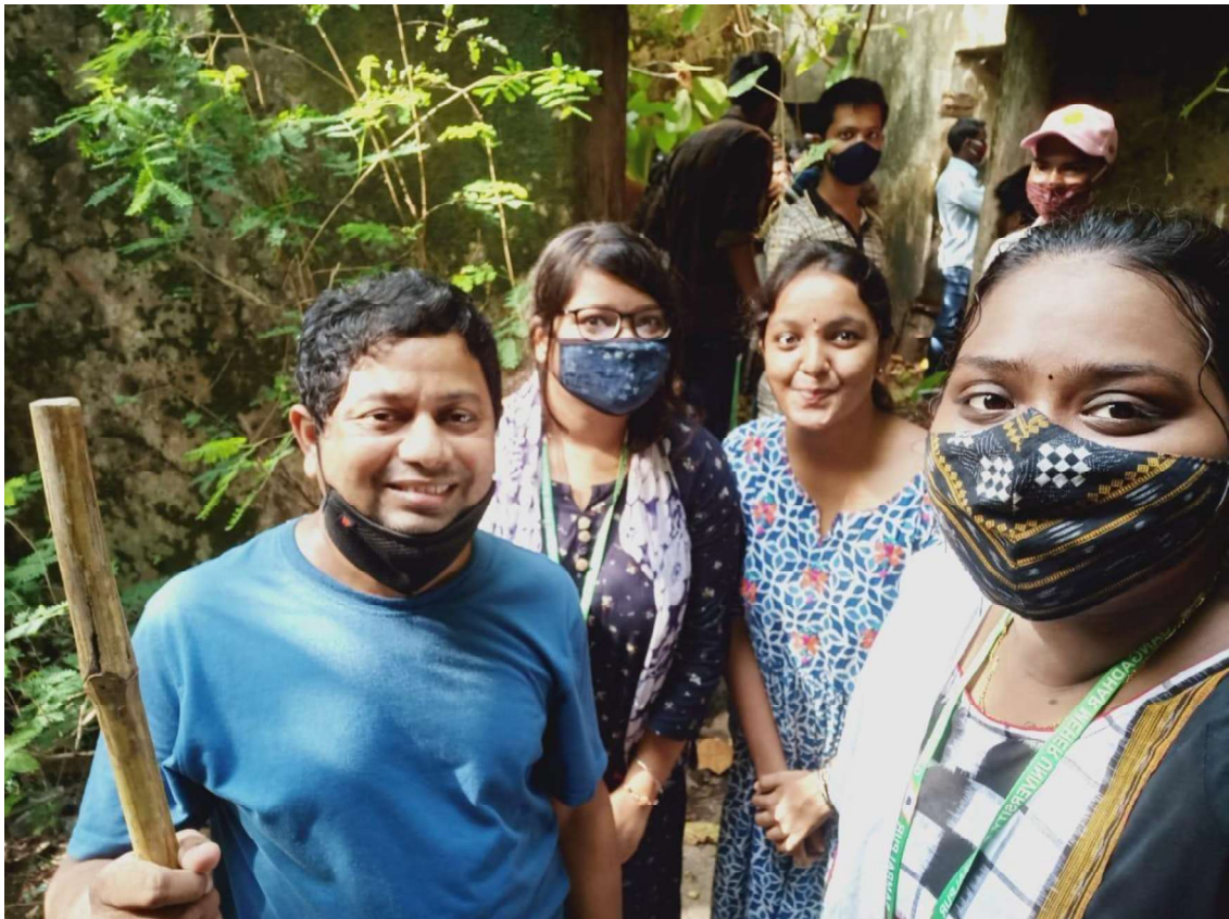
Heritage Club members at ruined palace, Raja bakhri