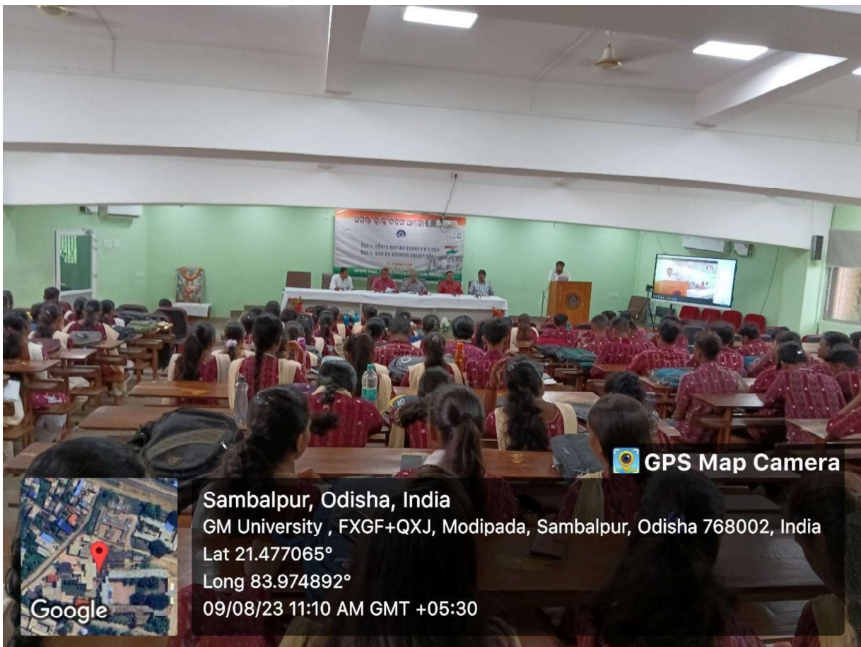
Observation of August Kranti on 9 th August 2023