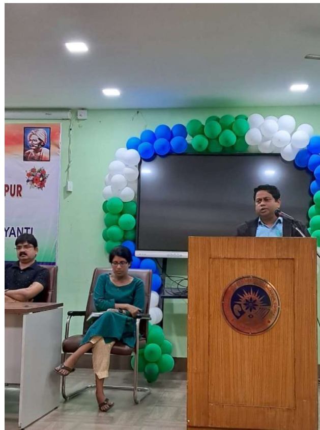
Celebration of Subhas Chandra Bose and Veer Surendra Sai Jayanti