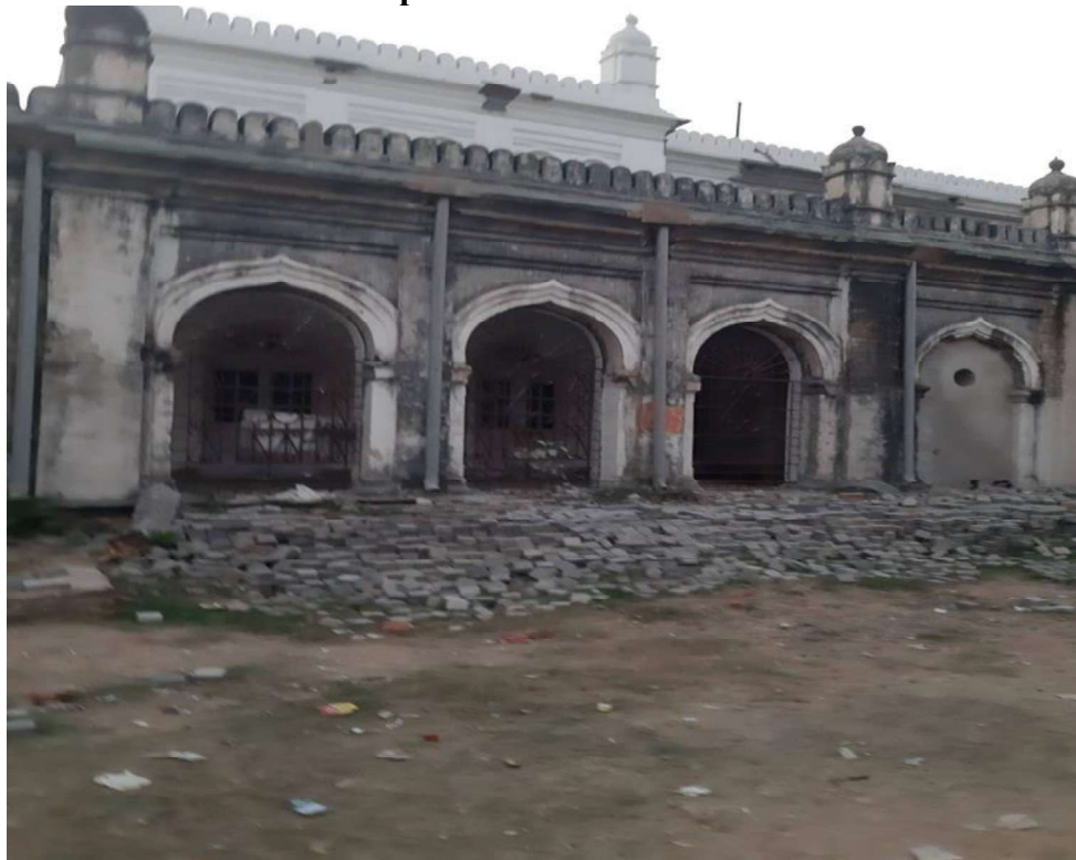
View of the Victoria Hall