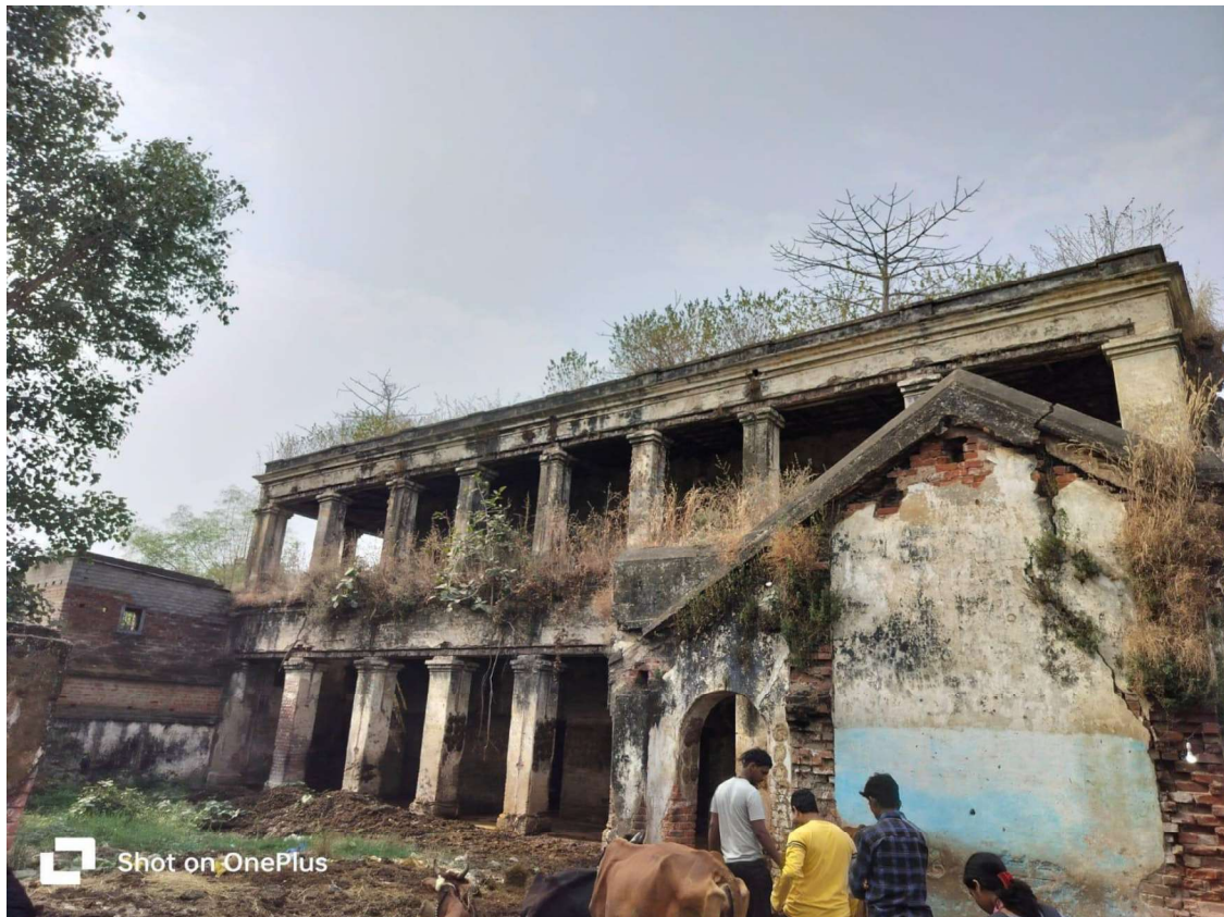
Heritage Awareness programme at Patna house