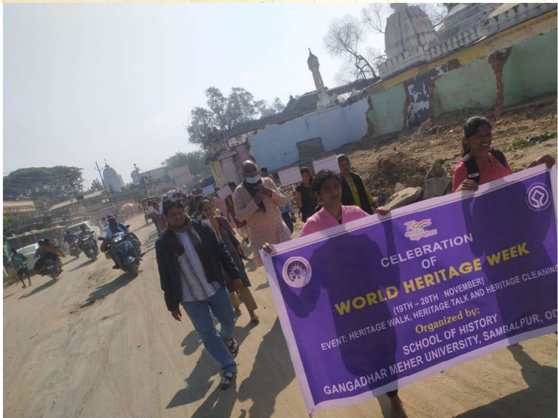
Heritage walk in the World Heritage Week 2022