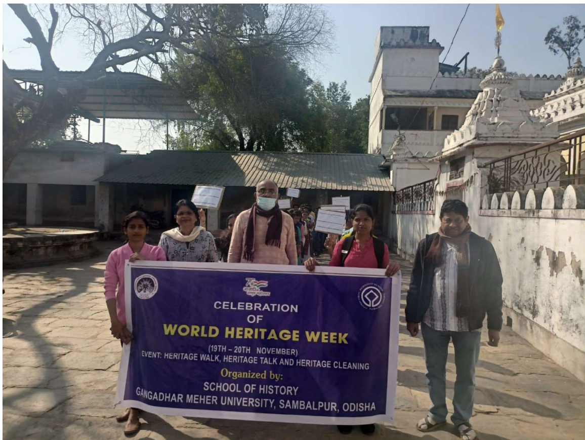
Celebration of World Heritage Week 2022