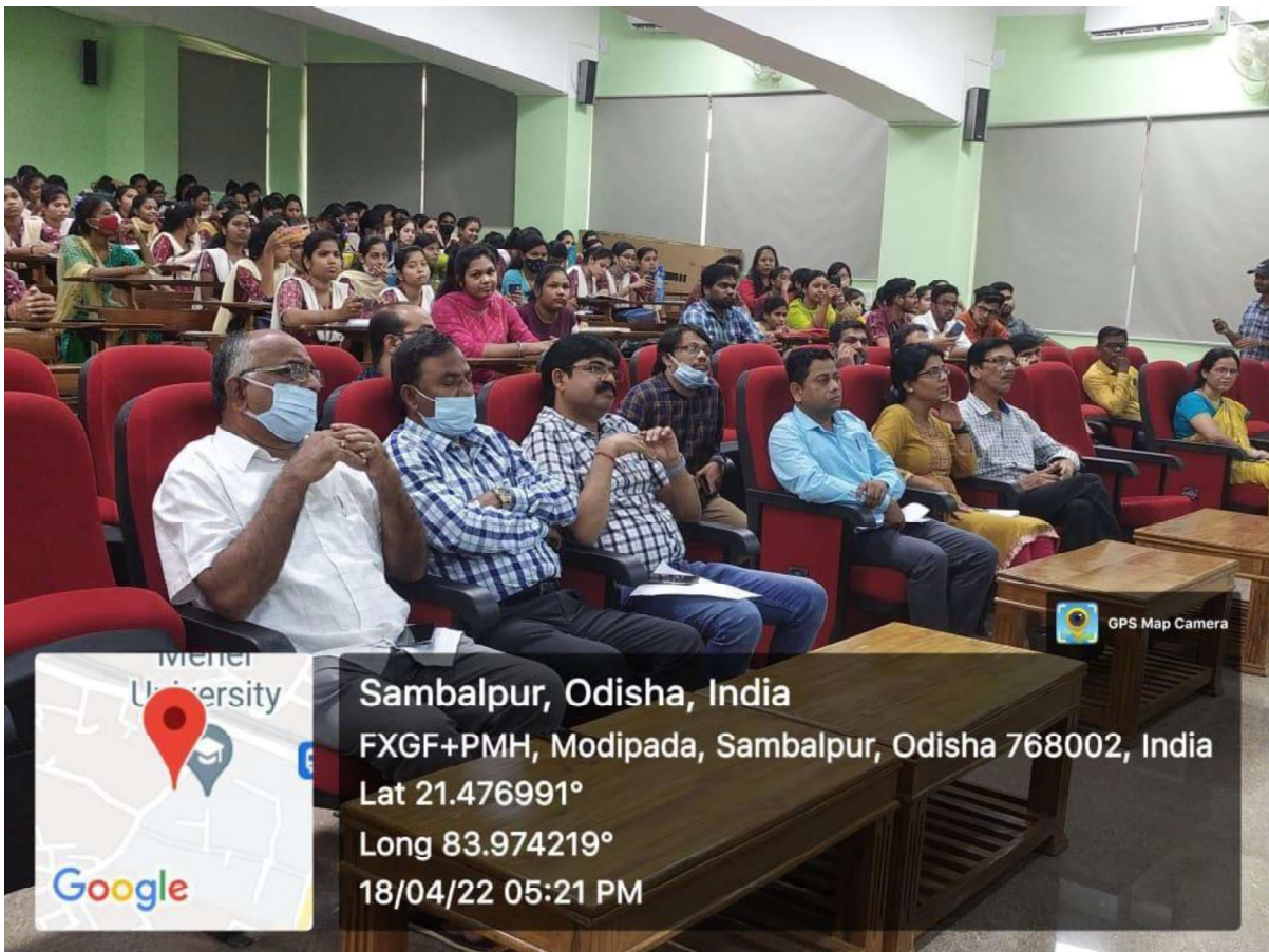
Students and scholars are participating in the Celebration of World Heritage Day 2022