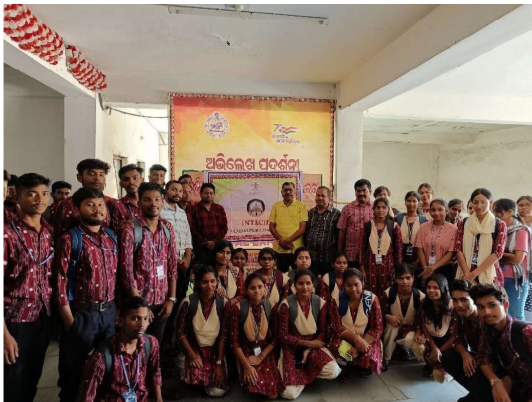
Students participated in the World Heritage day programme 2024