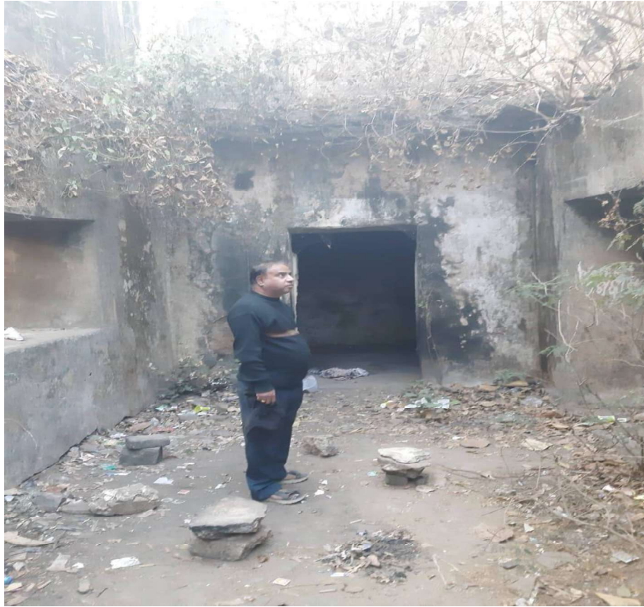
Ruined structure, Raja Bakhri