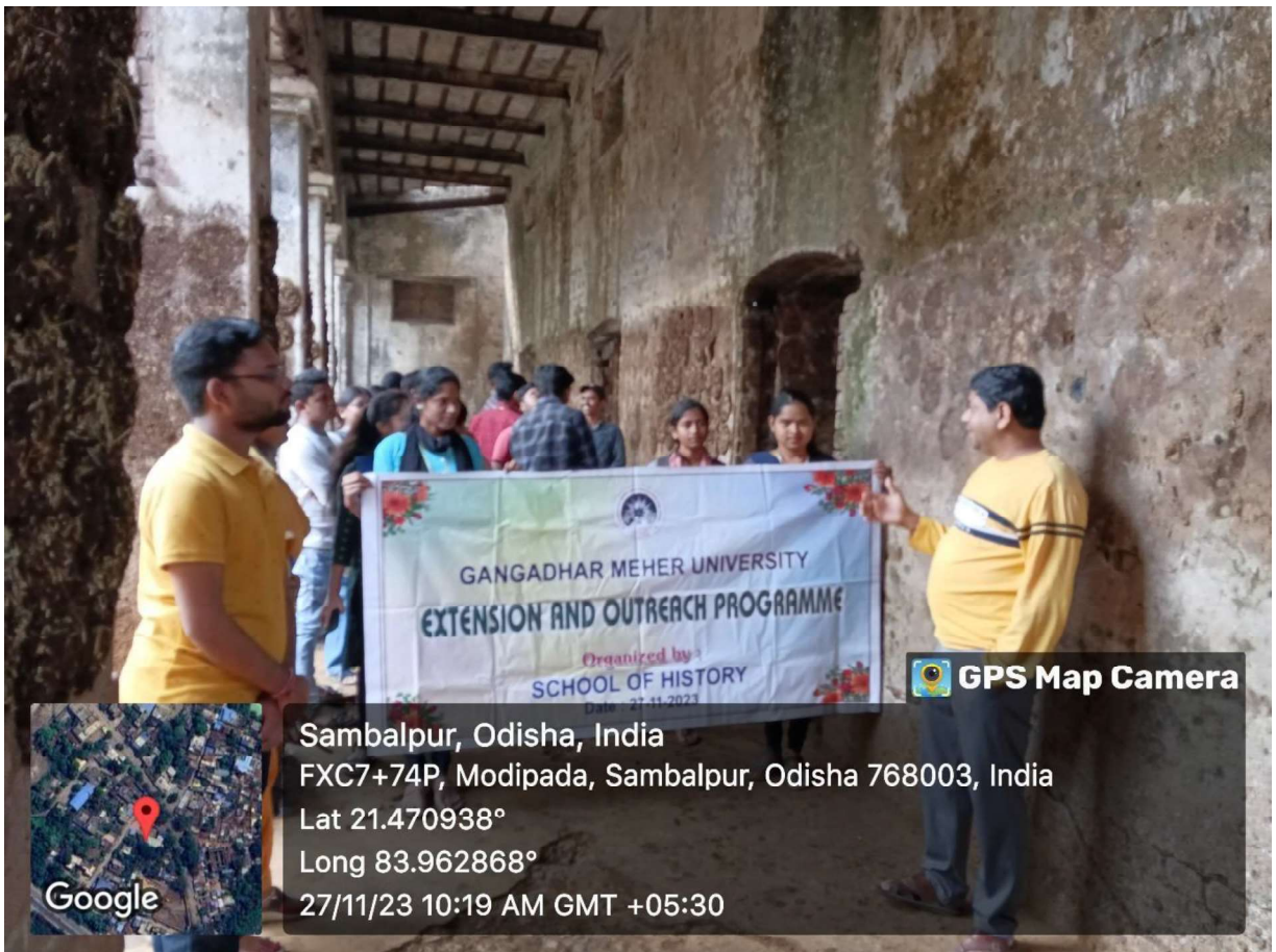
Heritage Awareness programme at Patna house