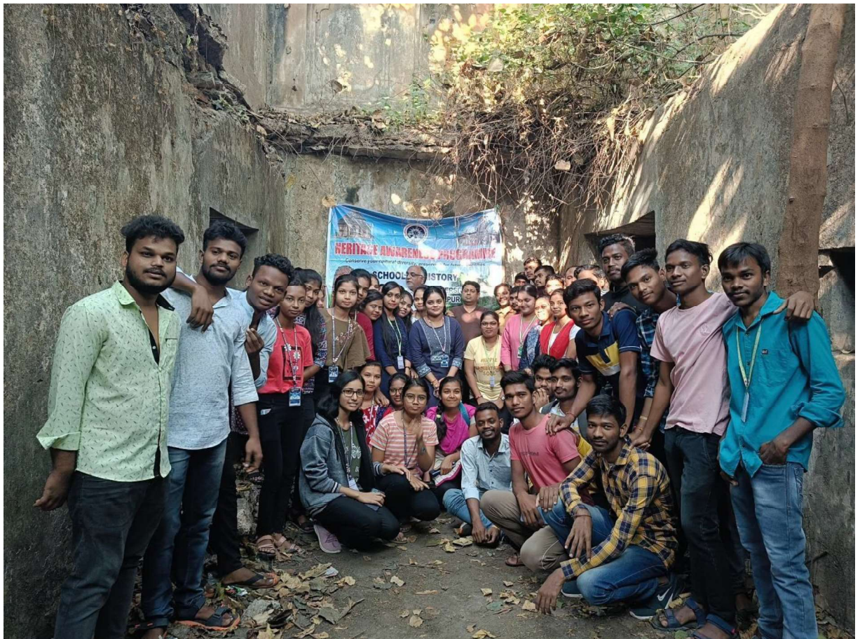
Celebration of World Heritage Week 2023 at Raja Bakhri