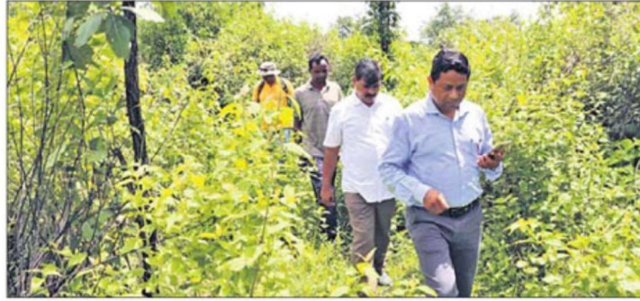
ଅସୁରଗଡ଼ରେ କେନ୍ଦ୍ରୀୟ ପ୍ରତ୍ନତତ୍ତ୍ୱ ବିଭାଗର ଚିମ୍ ।

ସମ୍ବଲପୁର, ୮।୯ (ବୁଧବେଳା) ସମ୍ବଲପୁର ଗଙ୍ଗାଧର ମେହେର ବିଶ୍ୱବିଦ୍ୟାଳୟ (ଜିଏମୟୁ) ଇତିହାସ ବିଭାଗ ଦ୍ୱାରା ଅସୁରଗଡ଼ରେ ଉତ୍ଖାନନ କରାଯାଇ ପ୍ରାଚୀନ ଇତିହାସ ସାମଗ୍ରୀ ଥିବା ନେଇ ପ୍ରମାଣ ମିଳିଥିଲା । ଏହାପରେ କେନ୍ଦ୍ର ଶିକ୍ଷାମନ୍ତ୍ରୀ ଧର୍ମେନ୍ଦ୍ର ପ୍ରଧାନଙ୍କୁ ଏହାର ସଂରକ୍ଷଣ ଓ ପୁରୁଷ୍କୃତ ରଖିବା ପାଇଁ ଜିଏମୟୁ ପକ୍ଷରୁ ଅନୁରୋଧ କରାଯାଇଥିଲା । ଜିଏମୟୁର ଅନୁରୋଧକ୍ରମେ ଗୁରୁବାର ଅସୁରଗଡ଼କୁ କେନ୍ଦ୍ରୀୟ ପ୍ରତ୍ନତତ୍ତ୍ୱ ସର୍ବେକ୍ଷଣ ସଂସ୍ଥା ଉତ୍ଖାନନ ଶାଖା-୪ର ଏକ ଚିମ୍ ପହଞ୍ଚିଥିଲା । ପ୍ରତ୍ନତତ୍ତ୍ୱ ବିଭାଗର