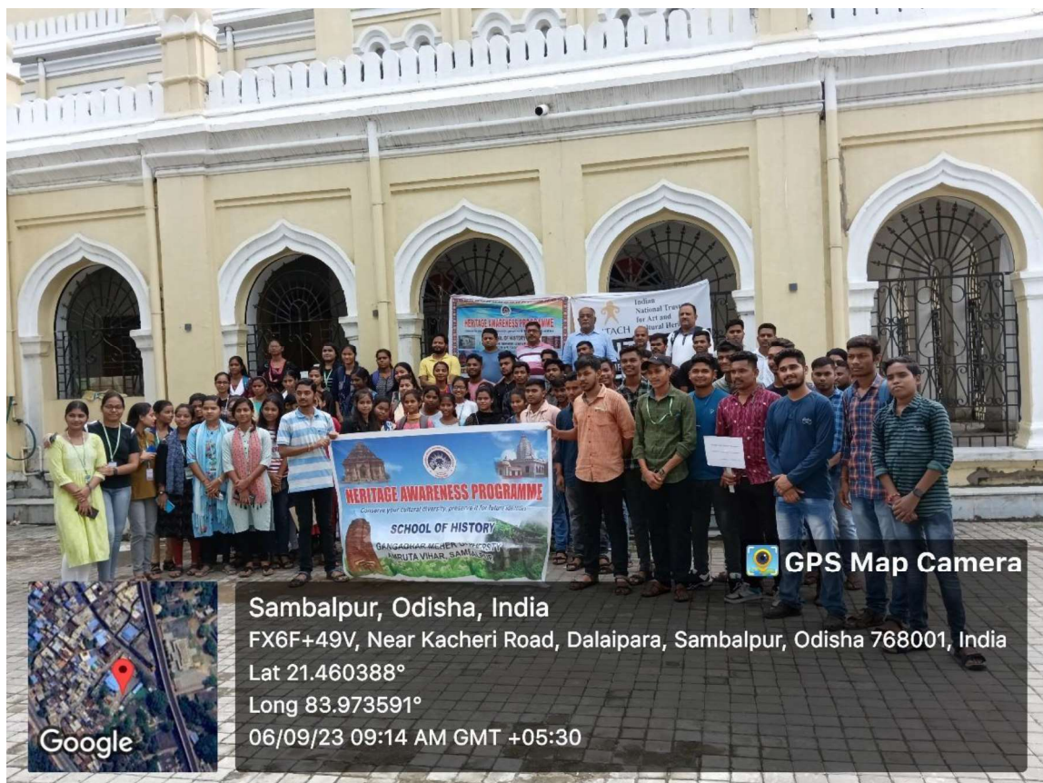
Students and participants in the Heritage walk