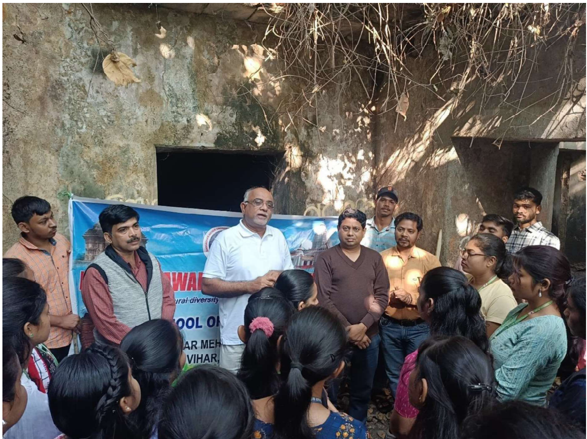
Celebration of World Heritage Week 2023

Conserve your cultural diversity, preserve it for future identities