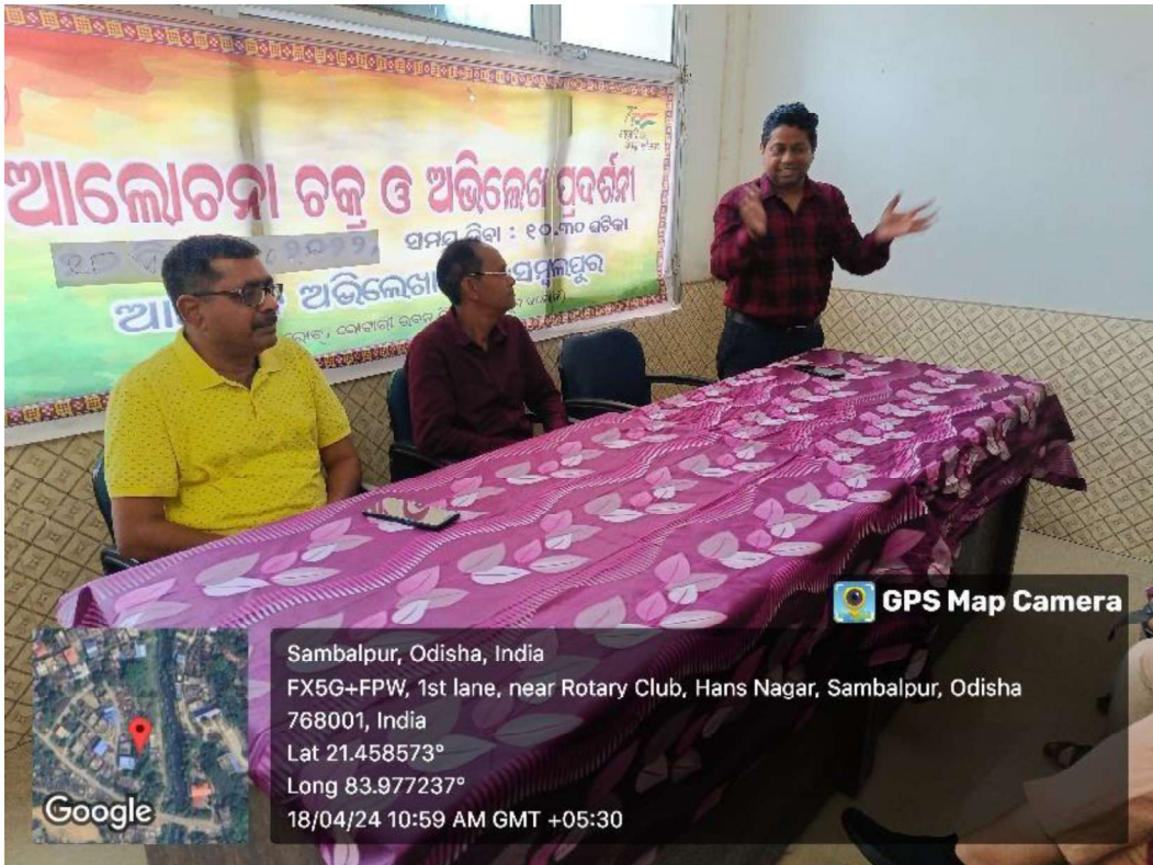
Celebration of World Heritage Day 2024