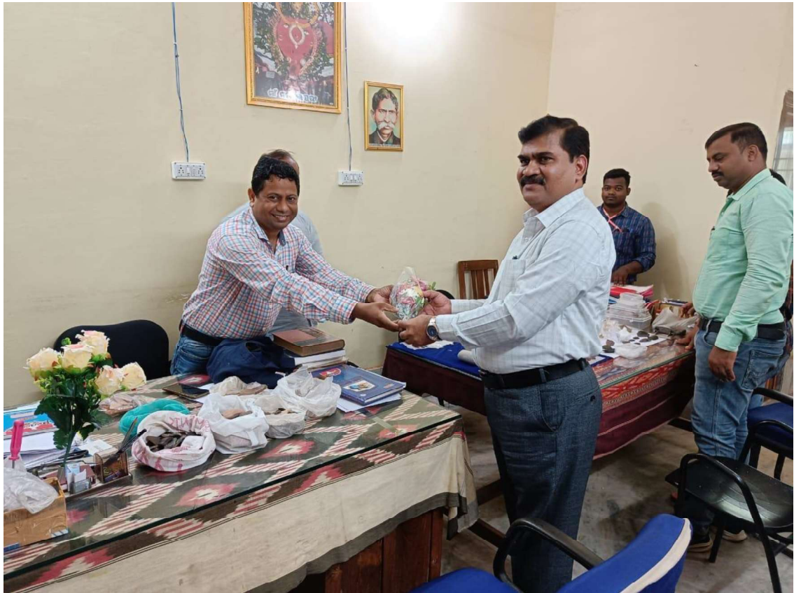
Team of Archaeological Survey of India visited the University to see the antiquities