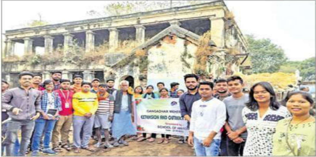
ପାଟଣା ରାଜପ୍ରାସାଦ ପରିଦର୍ଶନ କରିବା ଅବସରରେ ଛାତ୍ରାଛାତ୍ରୀ ।