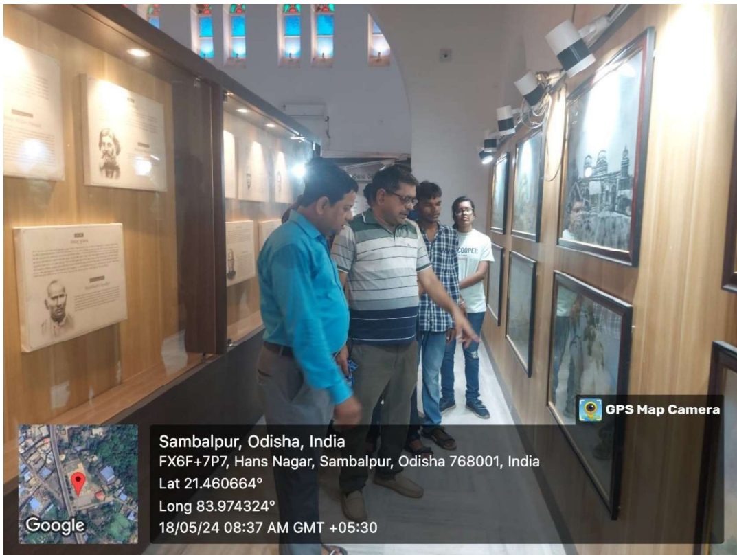
International Museum Day observed at Veer Surendra Sai hall 2024