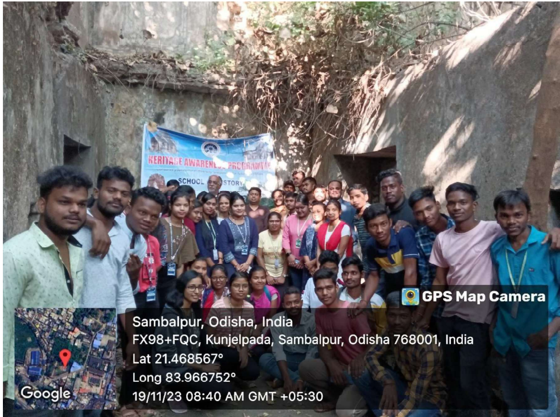
Celebration of World Heritage Week 2023 at Raja Bakhri