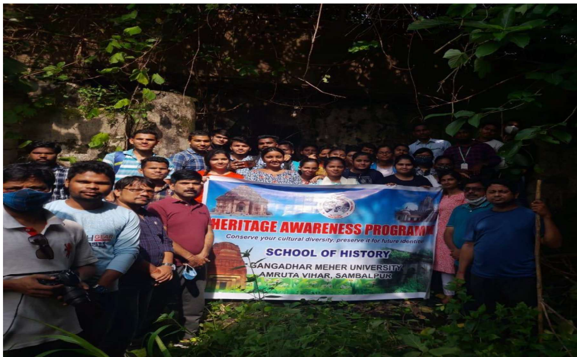
Heritage Awareness programme at Raja Bakhri