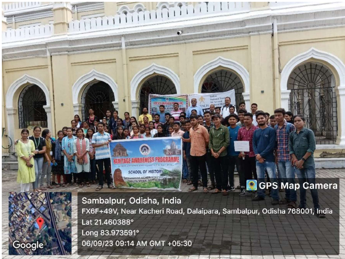
Heritage Walk from town hall to Lakshinath bezbaroa house