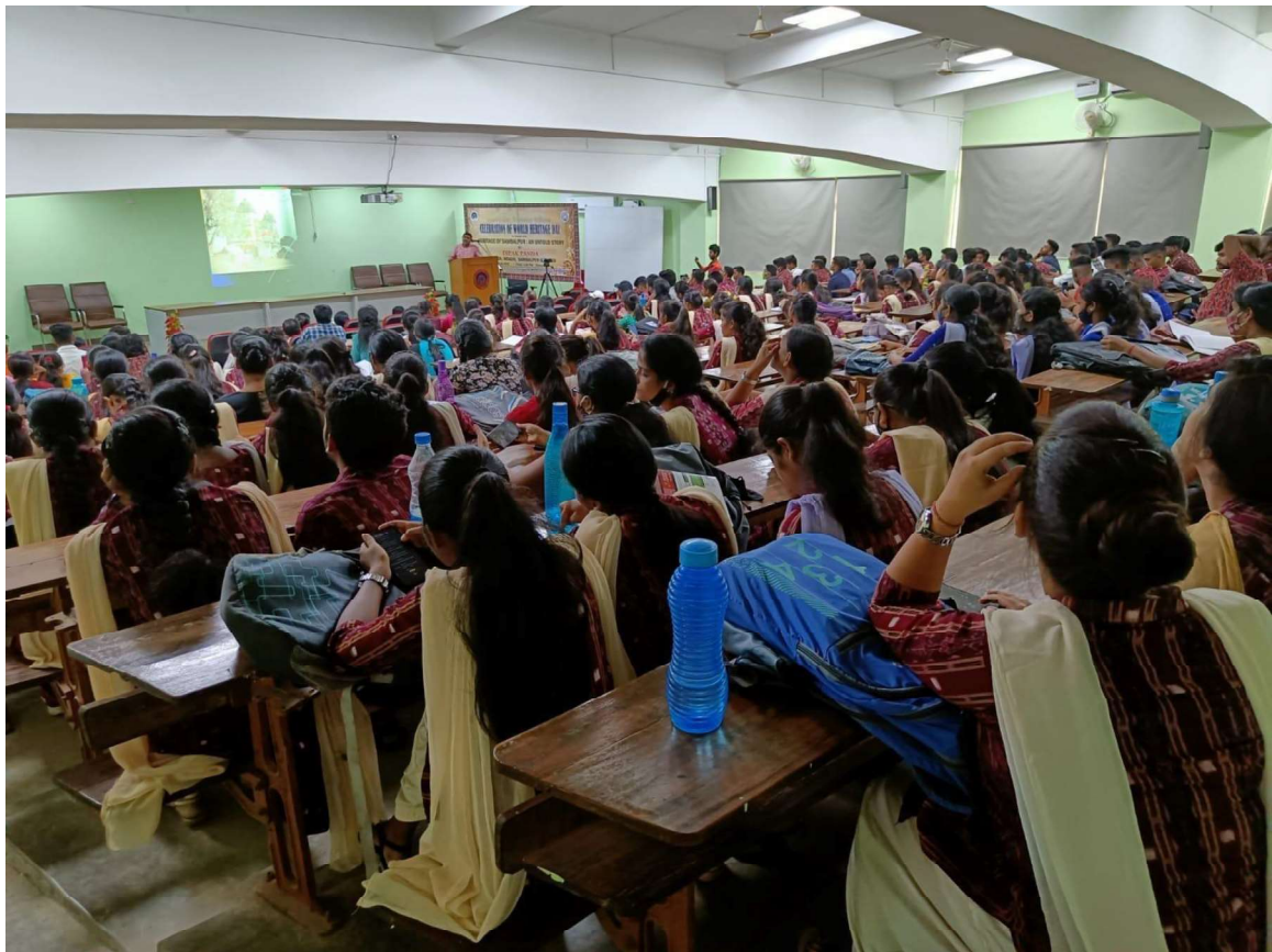
Students and scholars are participate in the Celebration of World Heritage Day 2022